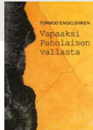
TORMOD ENGELSVIKEN Vapaaksi Paholaisen vallasta