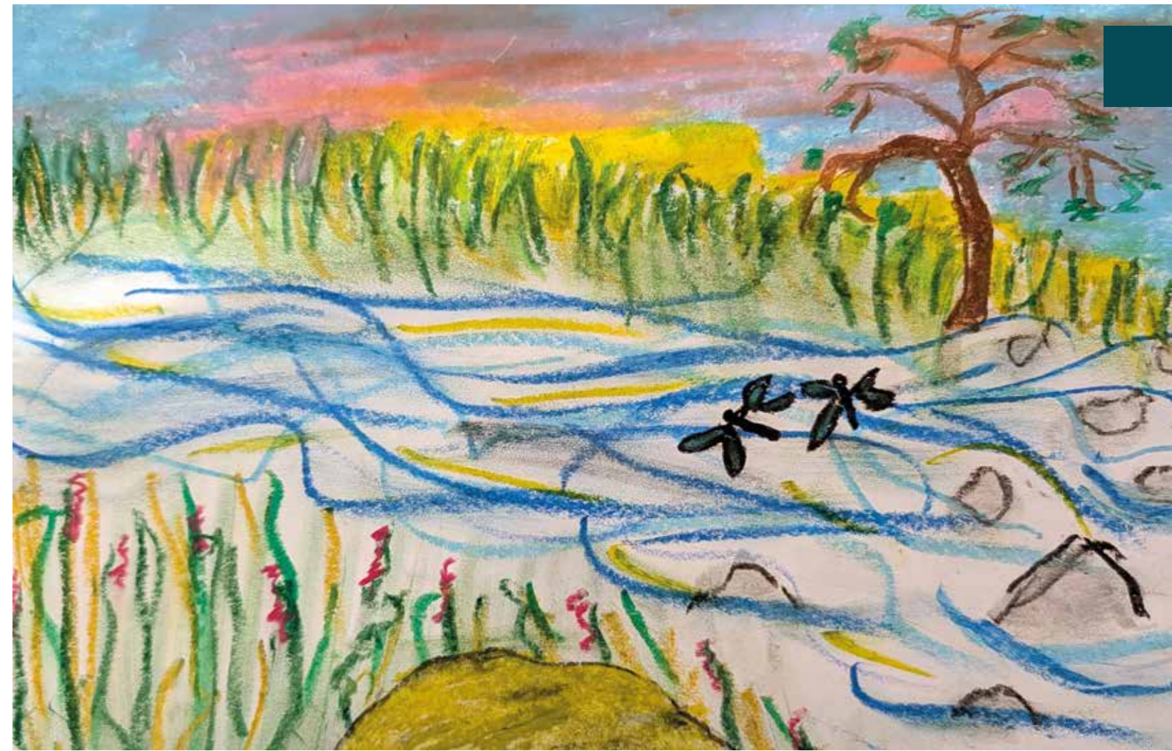
Toivon työpajan osallistuja piirsi kuvan turvapaikastaan.

Psykologisen tutkimuksen suorittaneet lähetit korostavat lähetin itsetuntemuksen tärkeyttä sekä valmiutta käsitellä omia traumojaan. Lähetti ja paikallinen elävät lopulta saman armon varassa. Keskeistä on sosiaalinen tuki ja se, ettei vaikeiden asioiden kanssa jäädä yksin, lähetti toteaa.