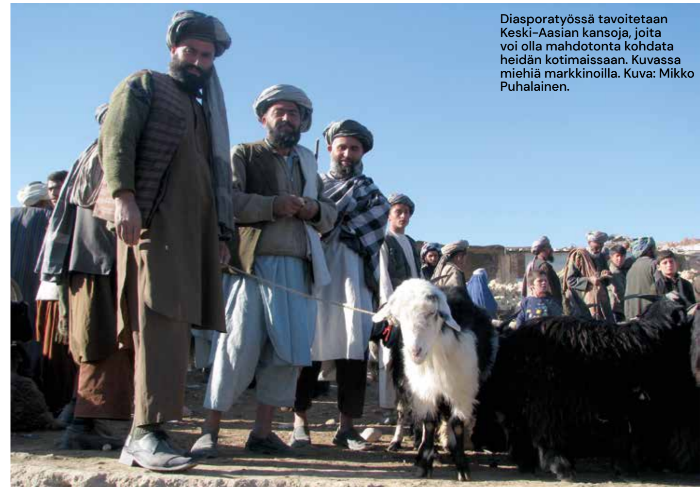
Diasporatyössä tavoitetaan Keski-Aasian kansoja, joita voi olla mahdotonta kohdata heidän kotimaissaan. Kuvassa miehiä markkinoilla.