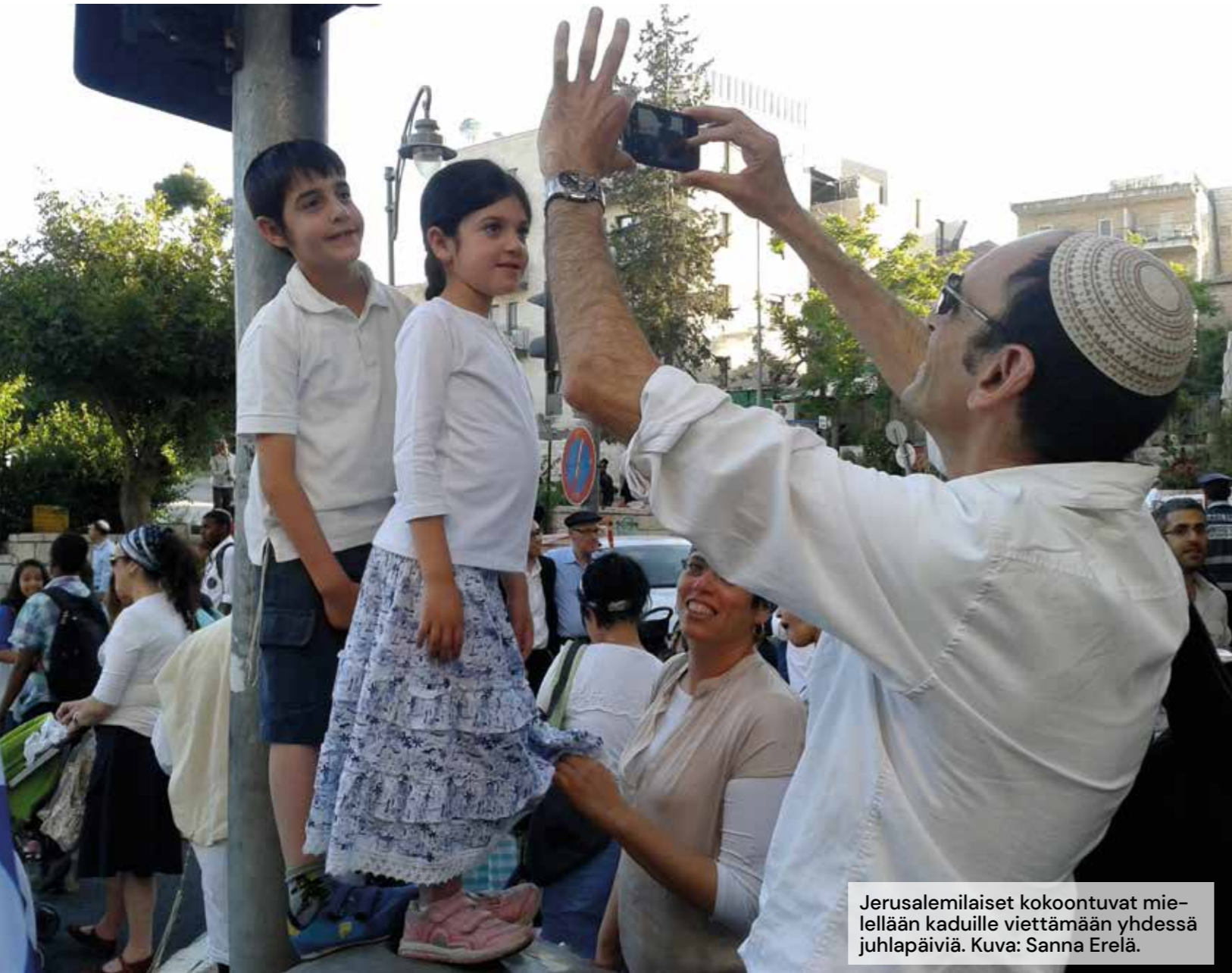
Jerusalemilaiset kokoontuvat mielellään kaduille viettämään yhdessä juhlapäiviä.

K ylväjä on olemassa, koska Jeesus antoi lähetyskäsken. Tehtävämme kastaa ja opettaa kiinnittää ihmisen Kristukseen ja seurakuntaan. Tätä yhteyttä rakennamme juutalaisten, diasporassa elävien ja muiden tavoittamattomien kansojen keskellä.