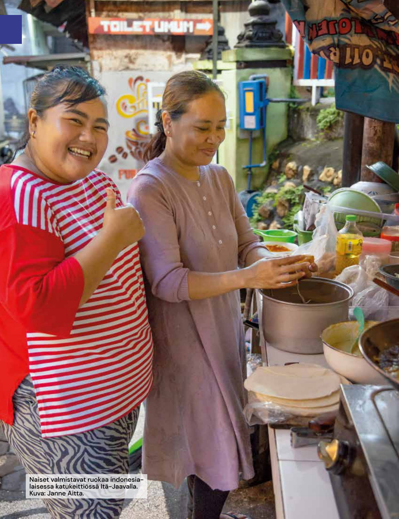
Naiset valmistavat ruokaa indonesialaisessa katukeittiössä Itä-Jaavalla.

D iasporassa elävien ihmisten määrä maailmassa kasvaa, ja saavuttamattomat kansat ovat tulleet luoksemme. Voimme siunata toisiamme uusilla tavoilla.